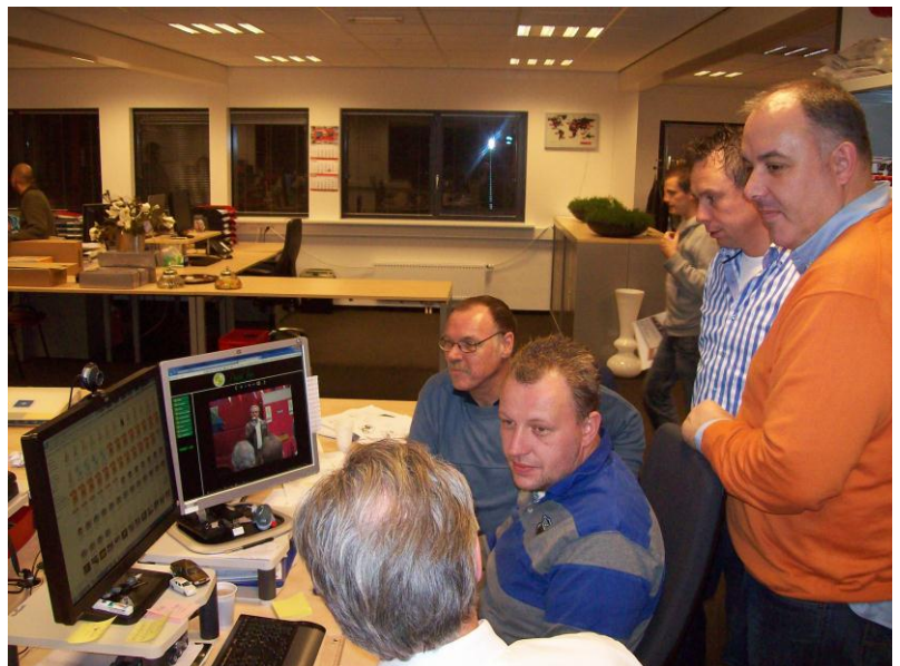
Onder: ook de directie kijkt even mee

Neem alvast een kijkje. Ze zijn uiteraard al van metaal. Weliswaar helemaal wit gespoten, maar je kunt al goed zien hoe ze er straks uit komen te zien. Links de VS50 met hier het plaatstuur, dat pas veel later geleverd gaat worden. Voorlopig krijgen we de sturen met spijltje!